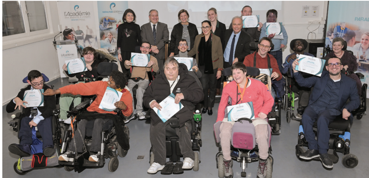
La première promotion lors de la cérémonie d'officialisation et de remise des diplômes de l'Académie des experts d'usages le 30 novembre 2023 à Paris.